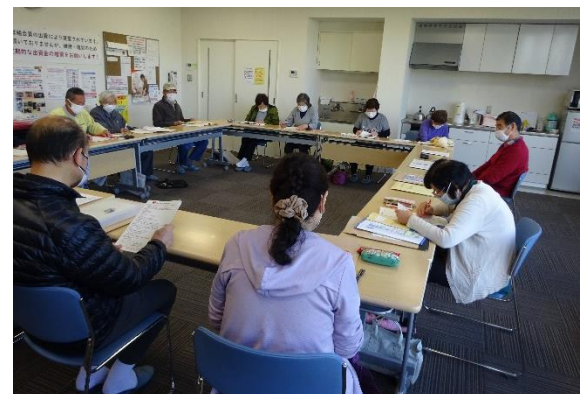
会議・運動はもちろん調理ができる設備も整っています。