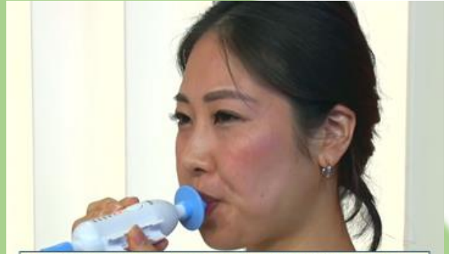
吹き口をくわえ 口角から息が漏れないように 勢いよく息を吹き込む