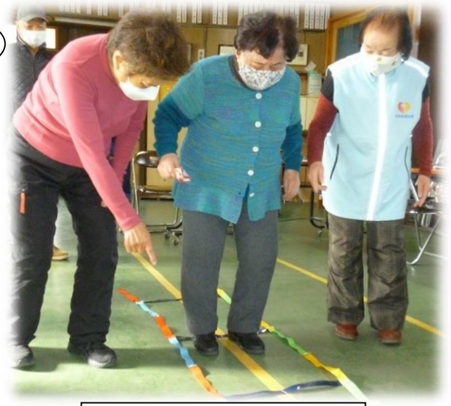
4色あしびみラダーで脳トレ