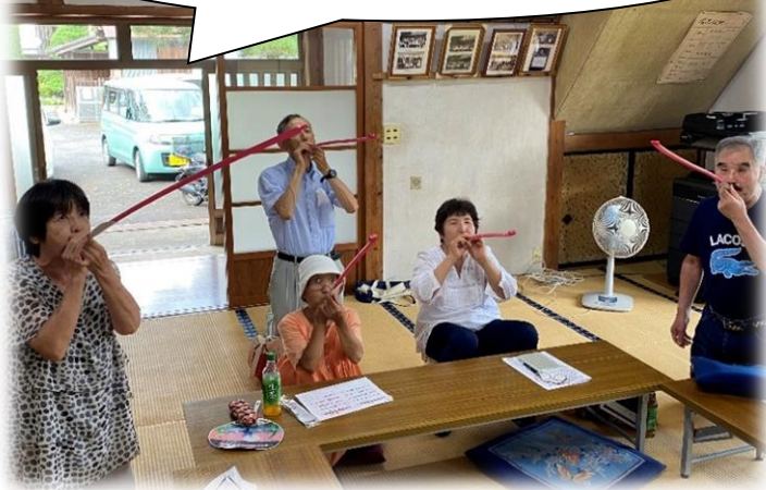
ピロピロでオーラルフレイル予防