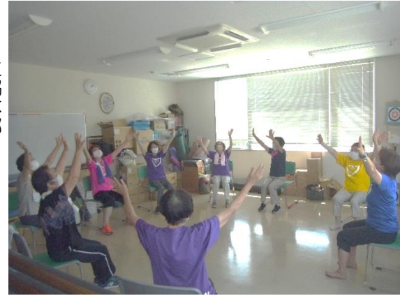
笑いヨガで健康維持