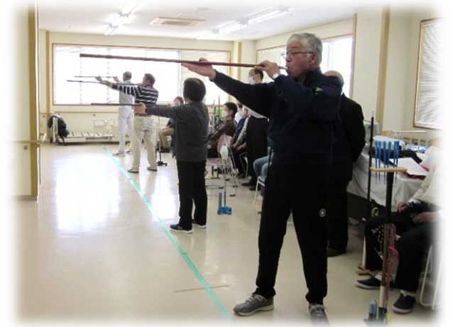
スポーツ吹き矢で楽しく腹式呼吸