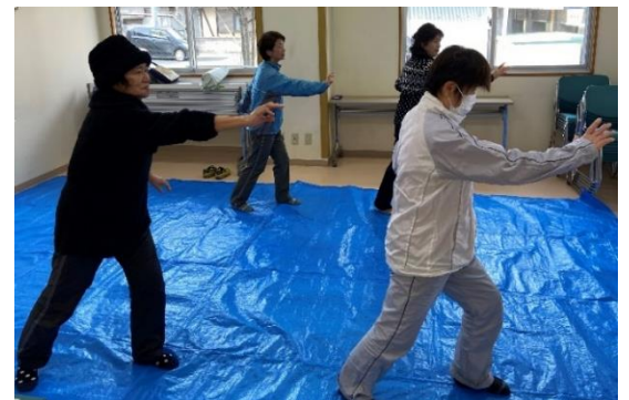
太極拳でリフレッシュ