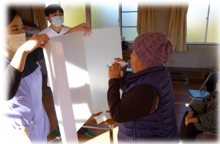
タスクルをつかって呼気圧測定