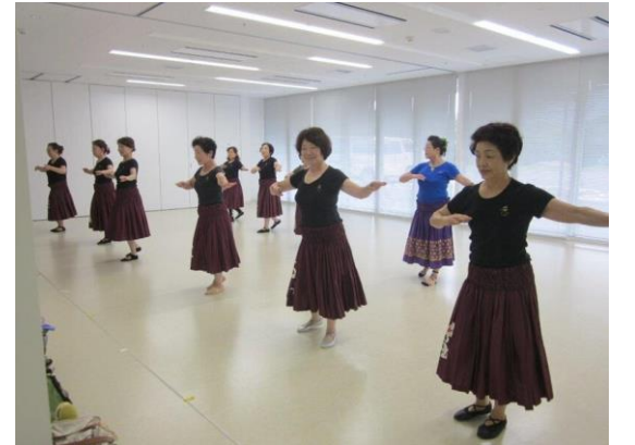
華やかにフラダンス