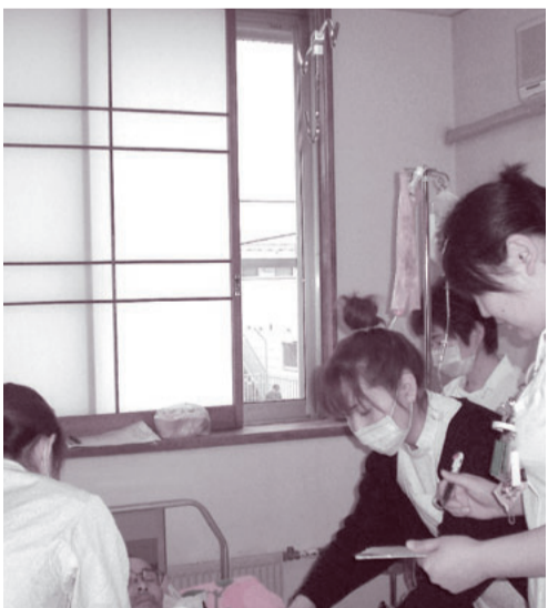
午前中のウォーキングカンファレンスをする4人の看護師

人に看護師や看護学生がいま 紹介やお問い合わせは、利根中央病院看護部長または総務課まで(224321)