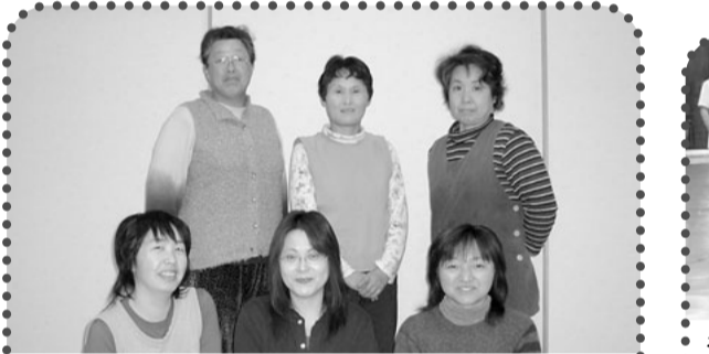
川場支部 中野班(血管年齢チェック) 血管年齢をチェックしました。笑顔はこんなに若いのに、血管はちょっと高齢者。食生活の改善と適度な運動を頑張って若返るぞ!!