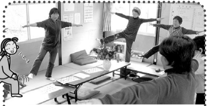
群馬農民連 女性部総会(転倒予防体操) 栄養のバランスも大切だけど、筋力のバランスも大事！元気なうちからしっかり体を動かして、みんなで「転ばない体づくり」をしましょうね