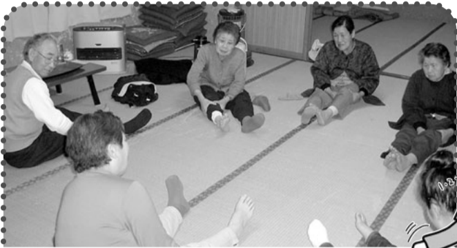
新治 谷地・宮原班(指圧とマッサージ) 20年ぶりの班会で膝のマッサージを実習中。「やったほうだけ温まってきたよ」と盛り上がりました。指圧の指導でも「これなら自分でもできる」「こういう班会、またやりたいね」と感想がありました