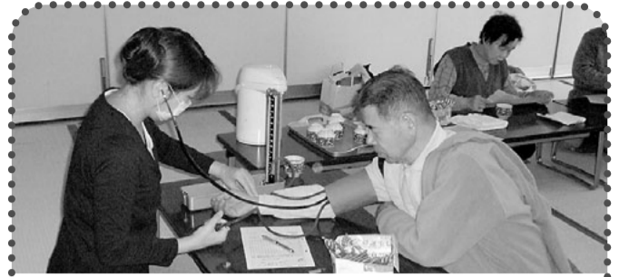
沼田東支部 上原合同班(血管年齢チェック) 「血圧も良いですね」。血管年齢チェックもみんなが年齢相応で「あ～良かった」とひと安心でした。貧血と低血圧の違いも学びました