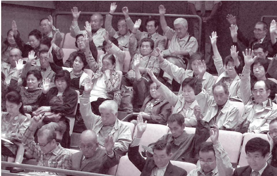
194人(内委任44)の参加で全議案を採択

発行人 都築 靖 発行部数 21,000 編集 「利根の保健」編集委員会 〒378-0053 沼田市東原新町1855番地の1 0278(22)4321 FAX(22)4393 事業所 利根中央病院 (22)4321 利根歯科診療所 (24)9418 老人保健施設とね (22)8855 とね訪問看護ステーション (23)3706 片品村健田 片品診療所 (58)3910 印刷 有限会社 コトブキ印刷