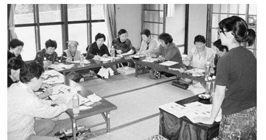
川田支部 下川田・田中合同班会

生協の目的は、安心して暮らせる地域づくりです。多くの声が実現される「夢をかたちに」するために組合員、役員職員の知恵と力を結集し、総力を挙げたとりくみで成功させましょう。