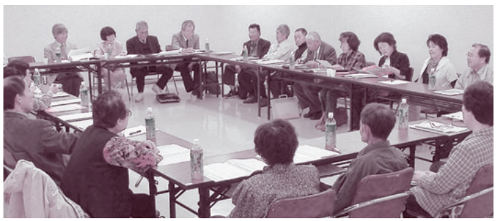
分散会で議案を深めあう