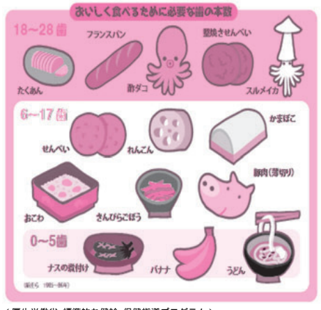
厚生労働省:標準的な健康・保健指導プログラム

現在4人に1人が目標達成! 現在すでに8020を達成されている方はどれくらいいるのでしょうか?