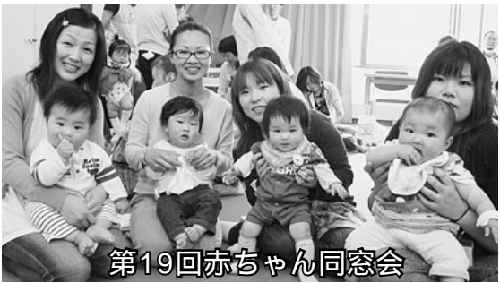
第19回赤ちゃん同窓会

7、とね診療所。精神科デイケア「ふれあいの輪」。念願の30人定員の拡大認可を8月に取得し、利用者の受け入れ増が可能となりました。利用者のニーズだった祭日のデイケア開放も行いました。新年度、利用者の要求である送迎サービスの実施、土曜日等のデイケア開放について検討します。