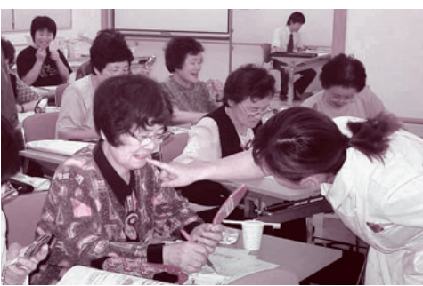
一日のカロリーを自身で計算

時間 午後7時~9時 会場 利根歯科診療所 受講費 2000円 申し込み 6月20日 連絡 申込み先 24941(利根歯科診療所)