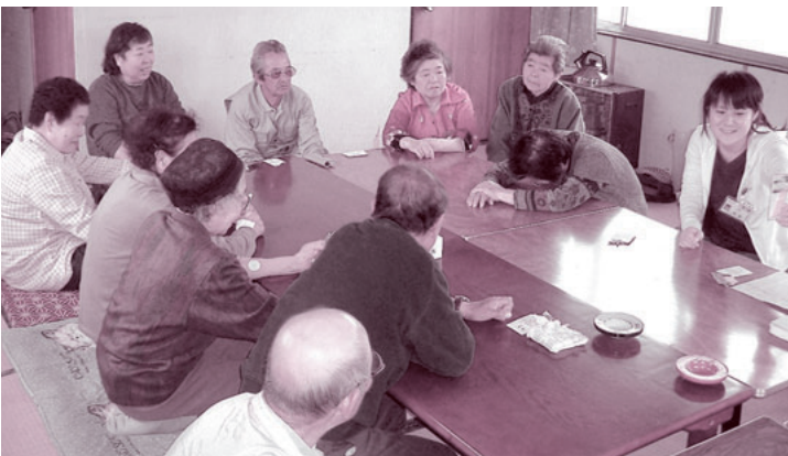
認知症予防の手遊びで楽しい班会

発行人 都築 靖 発行部数 21,300 編集 「利根の保健」編集委員会 〒378-0053 沼田市東原新町1855番地の1 0278(22)4321 FAX(22)4393 事業所 利根中央病院 (22)4321 利根歯科診療所 (24)9418 老人保健施設とね (22)8855 とね訪問看護ステーション (23)3706 片品村鎌田 片品診療所 (58)3910