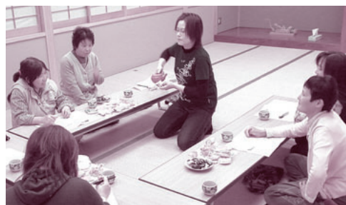
婦人会が中心の若い集まり中野班

予防と改善」から、簡単な計 算、音読が大切なことを学び ました。高齢者でも若々しい 声や、計算で百点をとって豊 かな表情に感動し、「いくつ になっても百点は嬉しいんだ ね」「私なんか、この年にな っても百点なんかとったこと ない」等の声。交流の中で も、「私は80を超えたが農 家の係長だ」「夫 婦で散歩、行った 先々でおしゃべり ばかりで運動にな っていない」の声 に「だけど頭の運 動にはなっている だろ」となど大 笑い。