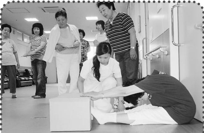
新婦人 沼田支部(体力チェック・脳トレ体操) 前屈や握力測定、片足立ちなどの体力チェックをしました。「次に測るときは、もっと良い結果に」と定期的に集まって体を動かすことになりました。