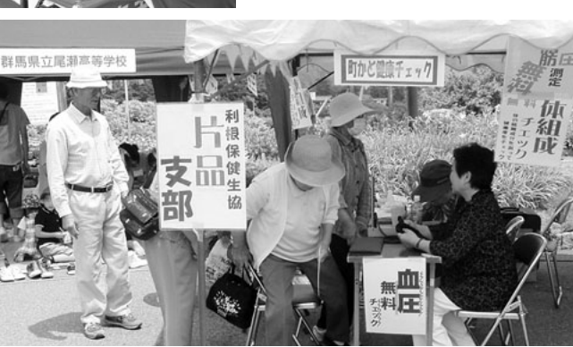
片品支部 「ふれあいパズル」の一回で行うまちかど健康チェックも今年で4年目。来場者35人の血圧、内臓脂肪チェックをしました。