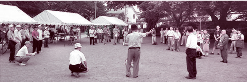
大坪事務局長(中央)を中心に、ボランティア参加者で意思統一

発行人 都築 靖 発行部数 21,400 編集 「利根の保健」編集委員会 〒378-0053 沼田市東原新町1855番地の1 0278(22)4321 FAX(22)4393 事業所 利根中央病院 (22)4321 利根歯科診療所 (24)9418 老人保健施設とね (22)8855 とね訪問看護ステーション (23)3706 片品村鎌田 片品診療所 (58)3910