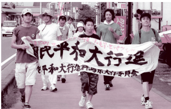
また今年は、病院の職員有志約20人が揃いの手作りTシャツを着て参加。「それいいね」と評判で、「今度は私たちが揃って参加したい」という人もいました。行進初参加の職員からも「少し抵抗あったけど意外と楽しかった。平和は大事だし、来年は一緒のTシャツで絶対に歩きます」と心強い声もありました。

核兵器廃絶と平和を訴えて歩く「国民平和行進」が7月5、8日で行われ、約2000人が歩きました。「網の目」行進は片品、川場、水上、新治をそれぞれ出発し沼田公園へ。当生協は片品コースを担当して、若手職員を中心に50人以上が歩きました。基幹コースは、沼田市役所から昭和村役場を経由して、渋川市役所まで元氣よく行進しました。