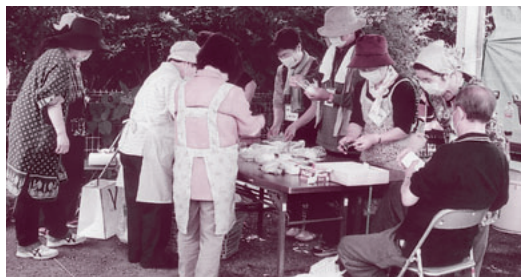
炊出しではおにぎり150人分、けんちん汁200杯を

40人の入村者のうち25人が看護師などの健康チェックを受け、うち9人が医師の診察を受けました。これら9人は健康上の問題もさることながら、いずれの方も無保険だったことが診察のなかで判明。理由は、保険料の支払いが困難なため保険証が交付されていないからです。中には数ヶ月前、自転車で転倒し腿の付け根を骨折したが、病院にいくば高額の医療費がかかるため激痛を我慢して生活していたという人も、多くは保険証