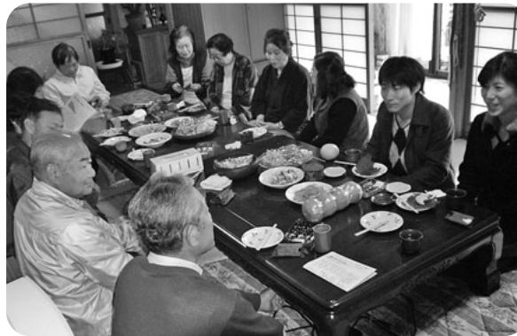
研修医も班会に参加(沼田北 原田神明班)