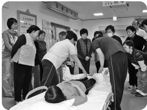
第1回介護教室(老健とね) 在宅での介護とリハビリの実技などを学習