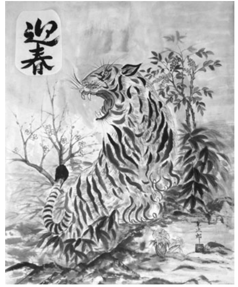
墨絵「不景気に吠える寅」 沼田市馬喰町 馬場 半次郎