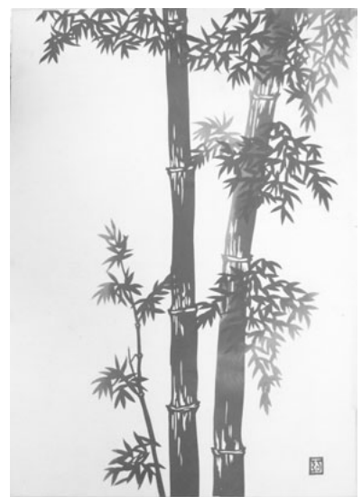
切り絵「朱竹」 沼田市東原新町 入沢 巧