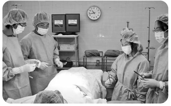
高校生一日医師・看護師体験 進路選択の一助に