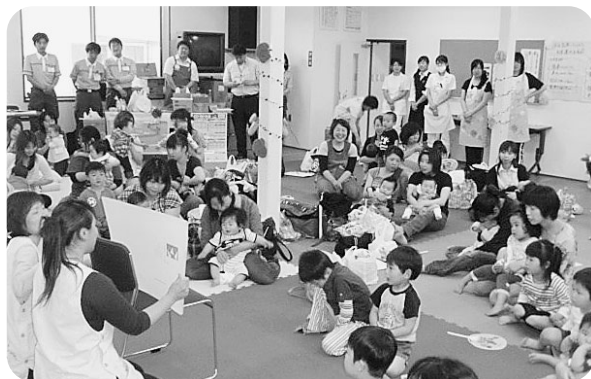
年2回開催の「赤ちゃん同窓会」 交流や育児相談ができて好評