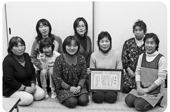
第41回県生協大会 川場支部中野合同班受賞