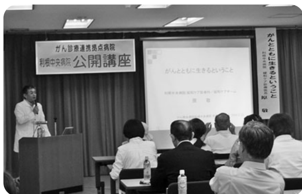
がん診療連携拠点病院として、 がんについて市民向け公開講座