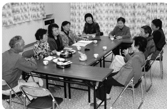
生協強化月間の意志統一 「支部運営委員会(新治支部)」