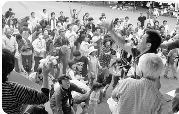
第27回くらしと健康まつり さまざまな催しに約3千人が来場