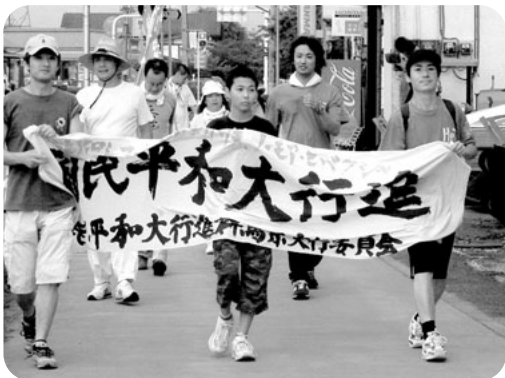
核兵器廃絶を訴え 国民平和進行