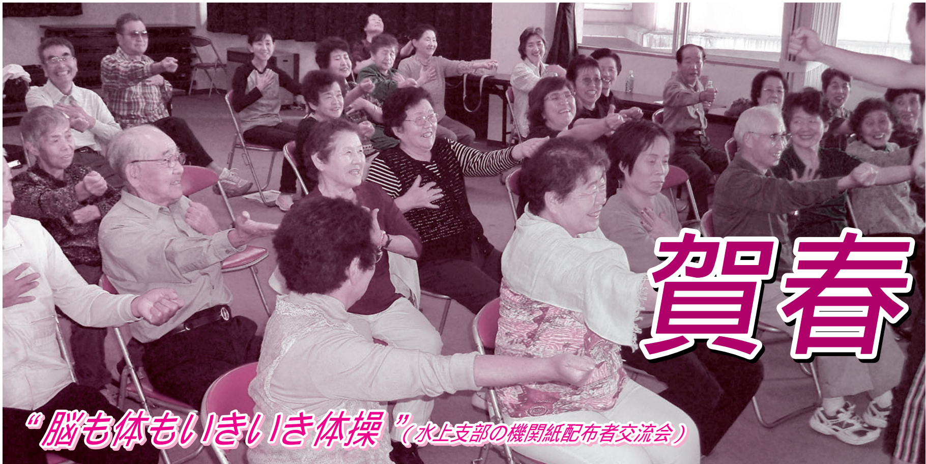
「脳も体もいきいき体操」(水上支部の機関紙配布者交流会)

発行人 都 築 靖 発行部数 21,400 編集 「利根の保健」編集委員会 〒378-0053 沼田市東原新町1855番地の1 0278(22)4321 FAX(22)4393 事業所 利根中央病院 (22)4321 利根歯科診療所 (24)9418 老人保健施設とね (22)8855 とね訪問看護ステーション (23)3706 片品村鎌田 片品診療所 (58)3910