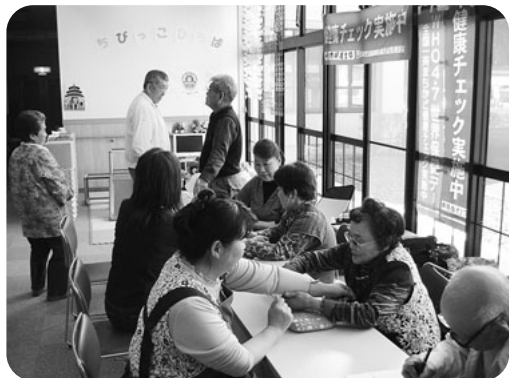
まちかど健康チェック 各地で活発に実施