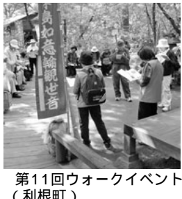
第11回ウォークイベント (利根町)

《脳を元気に》ラジオを聴くと想像力が膨らむ。頭の中で映像にして思い浮かべていると、脳の広い範囲が活性化されます。