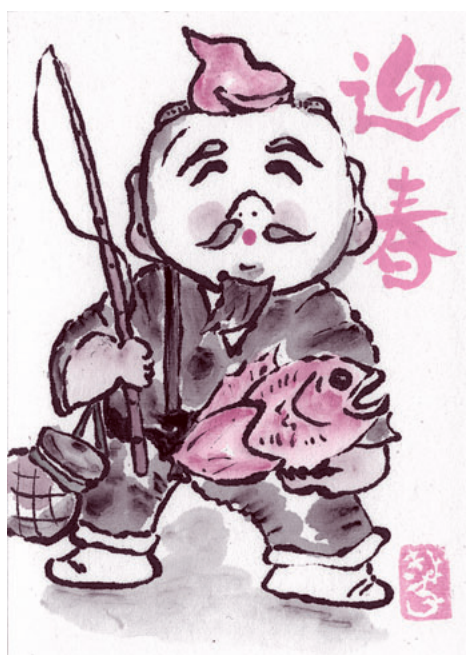
絵手紙 みなかみ町月夜野 山田清子