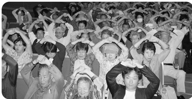
レインボー体操で寝たきり予防 関信越ブロック組合員活動交流会(前橋)