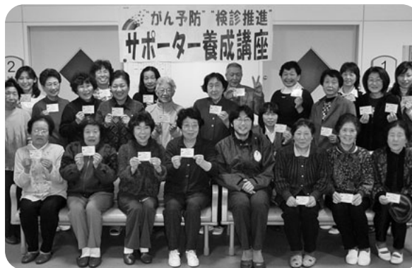
検診の大切さを学び広める「がん検診推進サポーター養成講座(認定証を手にする修了生)」