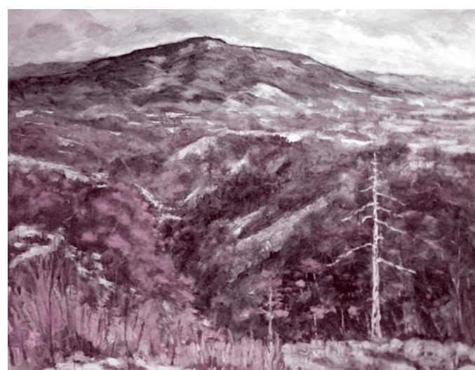
油絵「残雪」 白沢町岩室 中村一次