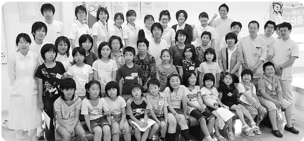
子ども歯の保健教室に18人が参加 歯を削る体験が好評