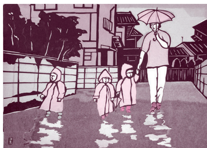
切り絵「お散歩の時間」<どんぐり保育園> 沼田市東原新町 児玉洋明