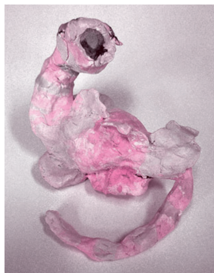
紙粘土「へなそうる」 絵本の中の恐竜 かねこ いっさ(6才)