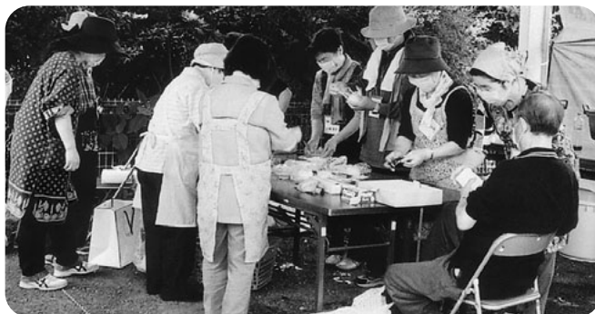
利根沼田派遣村 派遣切りやリストラにあった労働者らを支援