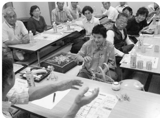
医長まねき「利根の保健」配布者交流会 (昭和東支部)