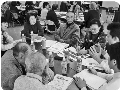
利根西部夢プランスタート集会 4支部51人で話し合い