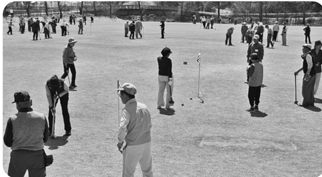
第1回支部対抗グラウンドゴルフ大会 全地域から600人が参加