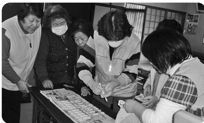
自分たちで大腸がんチェック(利南 下久屋原班)