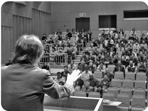
第32回保健組織活動交流会 237人の参加で盛大に