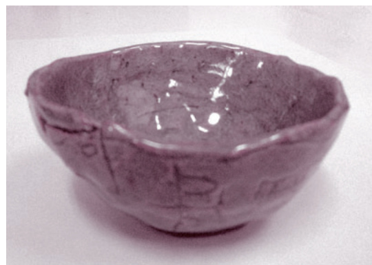
焼き物「お茶碗」 よしの なるみ(6才)