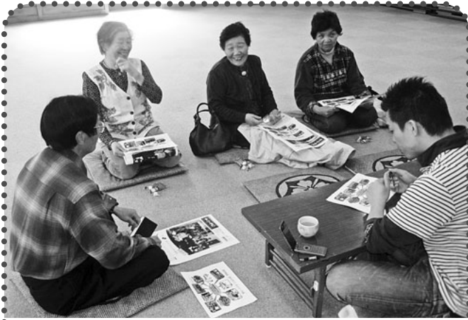
月夜野東 真庭・政所合同班(利根西部夢プランの話) 診療所づくりは、組合員が気軽に立ち寄れる『たまり場づくり』でもあるとの話がされました。「ひとり暮らしの人が増えているので、交流できるのは良いね」