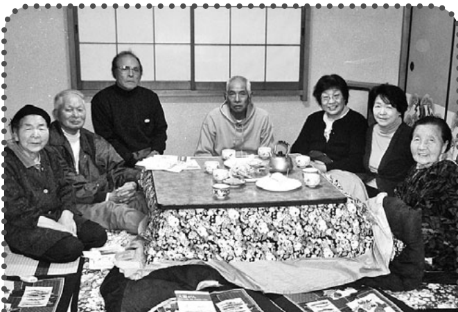
利根北 大楊班(大腸がんチェック・体組成チェック) 春、秋の年2回大腸がんチェックにとりこんでいます。今回は9人がチェックして、1人が陽性でした。また、体組成チェックを行なって、日頃の生活習慣を見直し、交流しました。