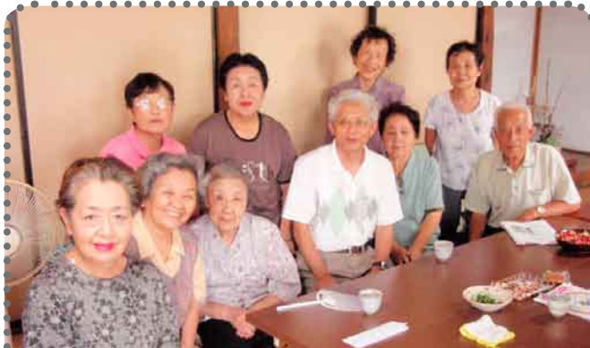
沼田南 坊新田町合同班 (健康は食生活から) 簡単な塩分・食生活チェックのあと食生活習慣病について学習...