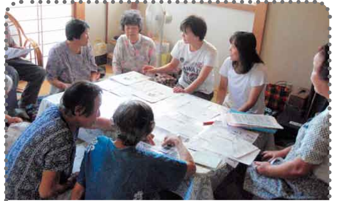
月夜野東 下牧原の中班 (肥満の話・尿・体組成測定) 尿チェックの結果が少し高く「漬物がおいしくて、つい食べ過ぎちゃう」と反省の声...