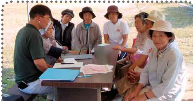
片品 菅沼合同班 (老人会と交流・簡易運動) 昼間しか集まらない老人会との交流。体操のDVDを見ながら要点を聞く...