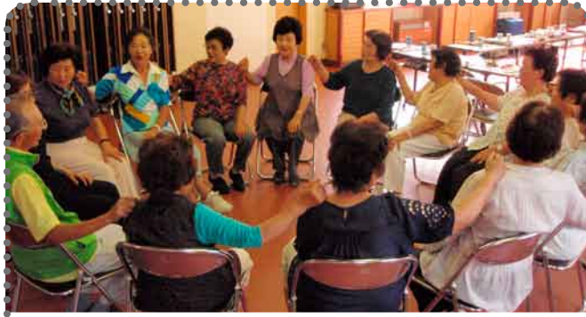
水上 湯原合同班 (レインボー体操) 月2回のコーラス練習日を利用して体組成チェックや脳トレ体操を実施...