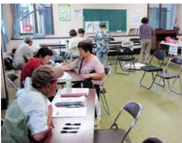
健康チェック「組合員で良かった」の声