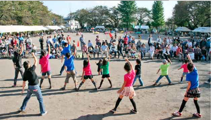
▲HIP HOPダンス T-mind 「歌とダンスで平和を」