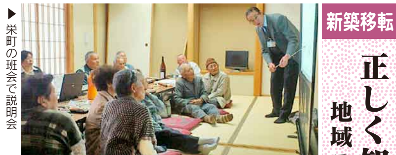
沼田東支部の説明会