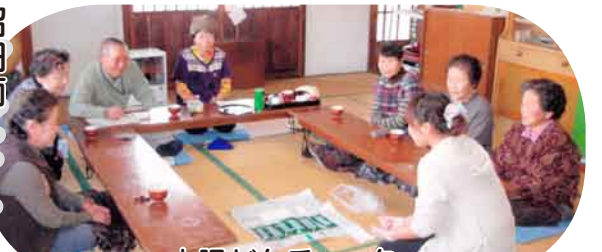
大腸がんチェック