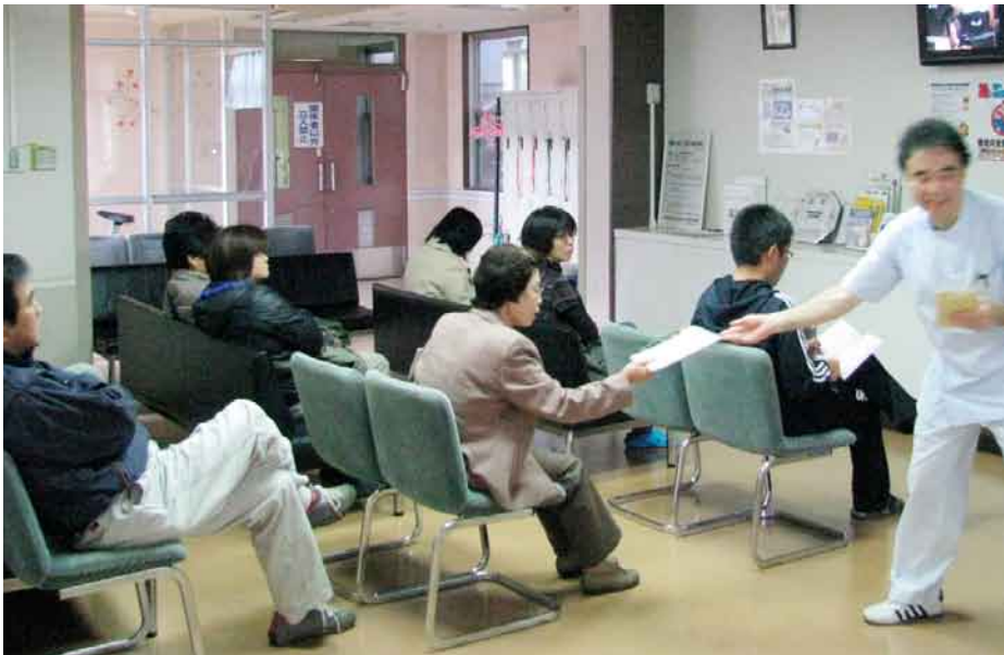
朝の受付場所も改善され、健診・ドック専用の待合室となった

利根保健生活協同組合 発行人 山田 忠夫 発行部数 21,400 編集 「利根の保健」編集委員会 〒378-0053 沼田市東原新町1908番地の6 ☎0278 (22) 6060 FAX (22) 6262 事業所 利根中央病院 ☎(22)4321 利根歯科診療所 ☎(24)9418 老人保健施設とね ☎(22)8855 とね訪問看護ステーション ☎(23)3706 生協みなみ歯科 ☎(25)3399 片品村鍼田 片品診療所 ☎(58)3910