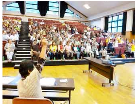
生協強化月間に向けスタート集会 5会場で368人が集う(みなかみ会場)