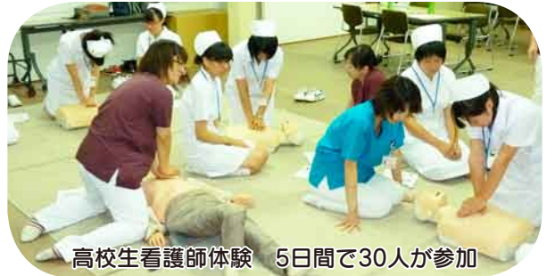
高校生看護師体験 5日間で30人が参加