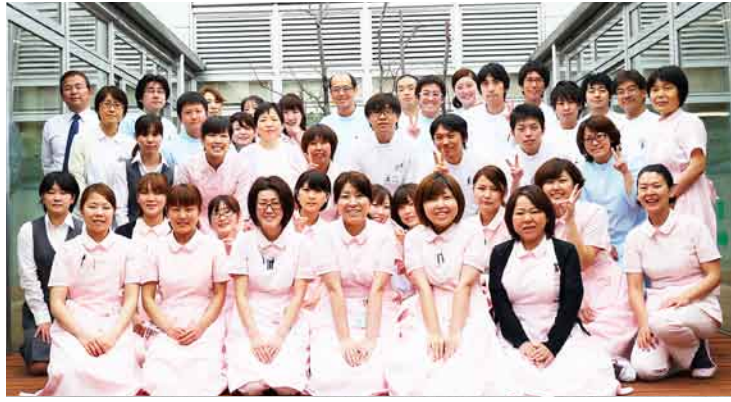
利根歯科30周年企画 スタッフ勢揃い