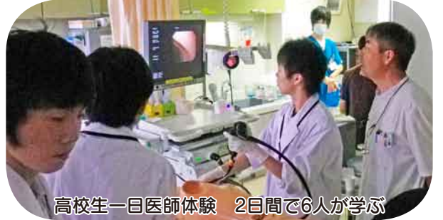
高校生一日医師体験 2日間で6人が学ぶ