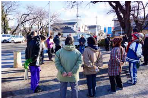
反貧困ネット「なんでも相談会」 炊き出し等ボランティアに30人