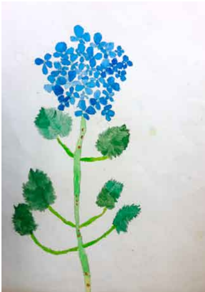
水彩画「あじさい」 熊の子保育園 5歳児