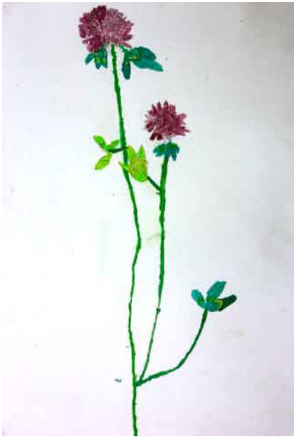
水彩画「あかつめくさ」 熊の子保育園 5歳児