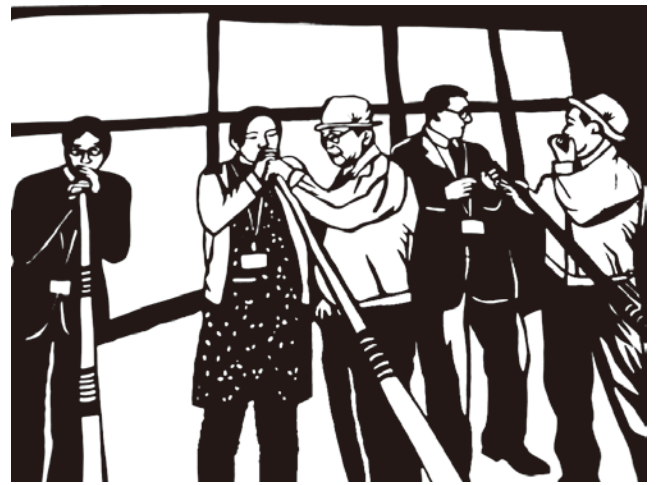
切り絵「ホルン体験」

晩景寒鴉集 秋風旅雁歸 水光浮日去 霞彩映江飛 洲白蘆花吐 園紅梯葉稀 長沙卑雪地 九月未成衣 沼田市高橋場町 笛木力三郎