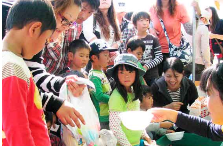
利根中央病院「きらめき祭」でボールすくいを楽しむ