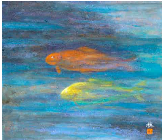
日本画「鯉」 沼田市西倉内町 田中穂積