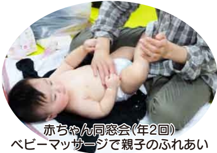
赤ちゃん同窓会(年2回) ベビーマッサージで親子のふれあい