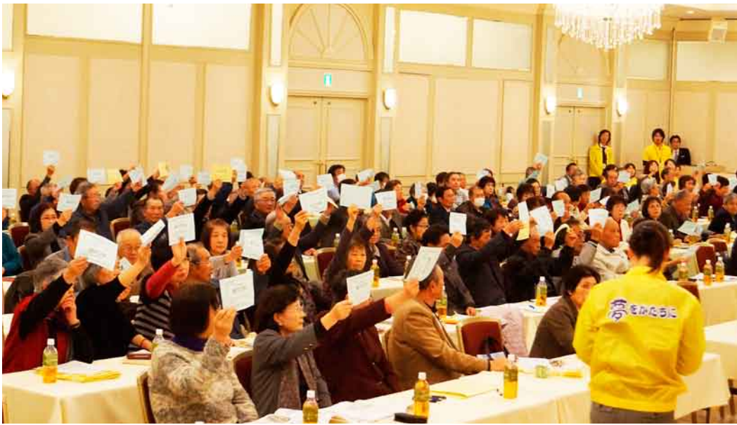
賛成多数により2つの議案が承認された