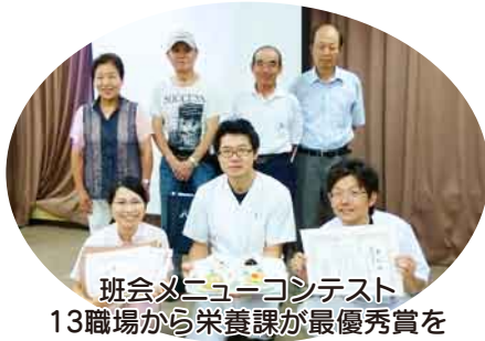
班会メニューコンテスト 13職場から栄養課が最優秀賞を