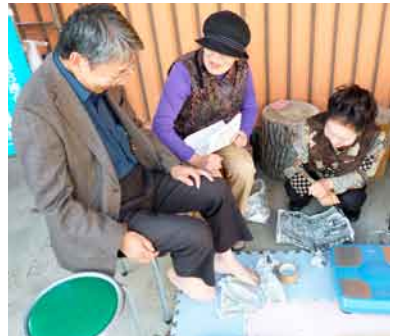
沼田東まちかど健康チェック 足指力チェックで転倒予防を