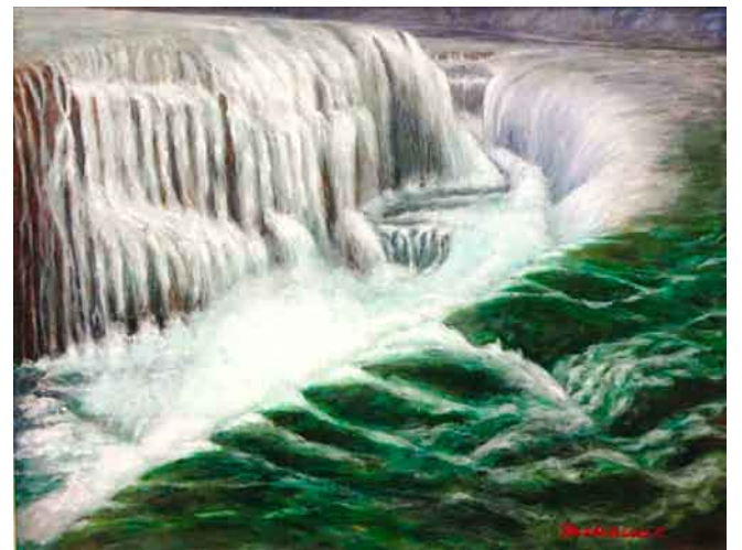
油絵「春のおとずれ」 沼田市利根町 千明利久