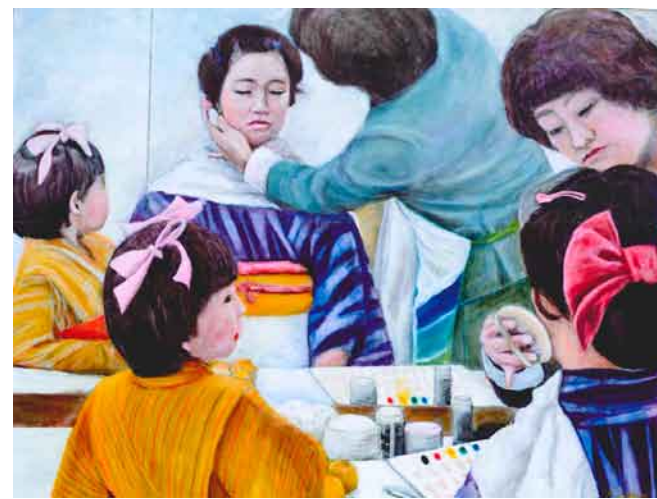
油絵「上演30分前」 沼田市町田町 桑原俊仁