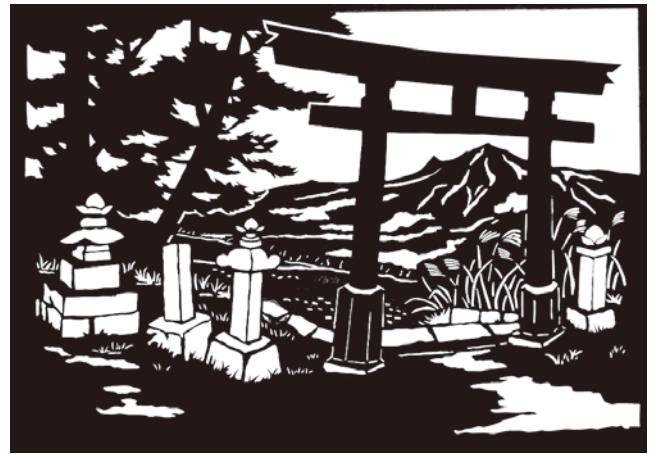
切り絵「川内神社境内(三峰)より」