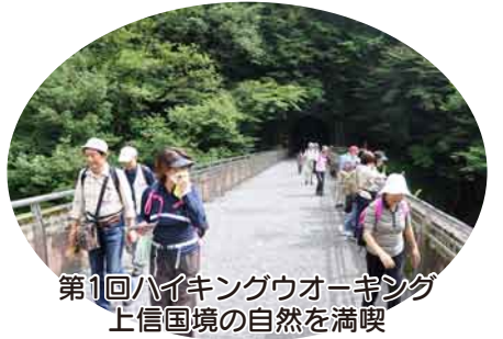
第1回ハイキングウォーキング 上信国境の自然を満喫