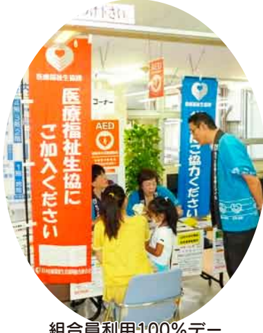
組合員利用100%デー 毎月0の付く日に 生協加入の呼びかけ