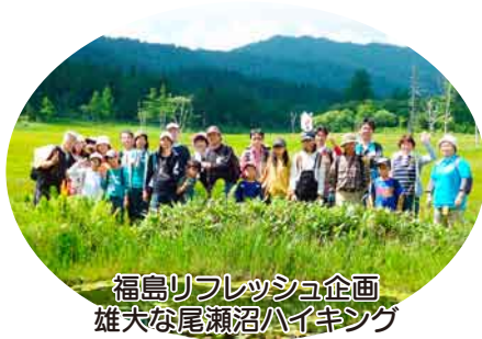
福島リフレッシュ企画 雄大な尾瀬沼ハイキング