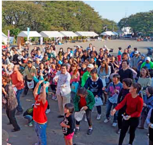
くらしと健康まつり フィナーレの餅投げでにぎわう