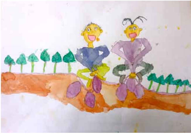
水彩画「さつまいもほり」 熊の子保育園 5歳児