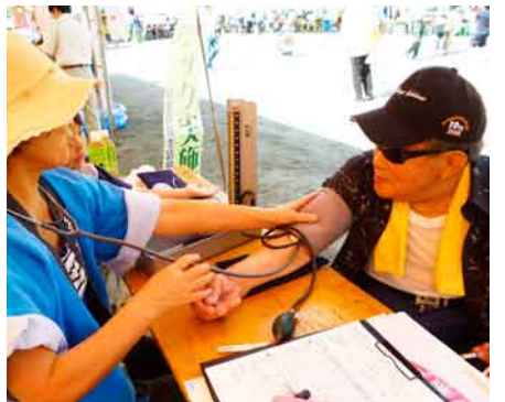
「とねふるさと風のまつり」会場での健康チェック(利根北)