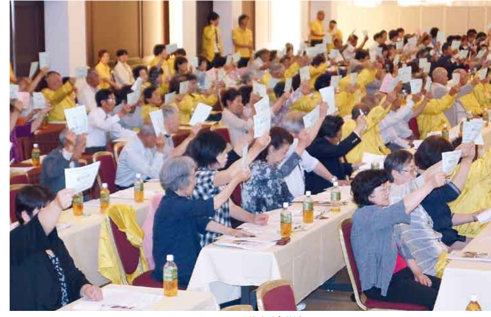
すべての議案が議決

利根保健生活協同組合 〒378-0053 沼田市東原町1861番地1 ☎0278(22)6060 FAX(22)6262 事業所 利根中央病院 ☎(22)4321 利根歯科診療所 ☎(24)9418 介護老人保健施設とね ☎(22)8855 とね訪問看護ステーション ☎(23)3706 とねね診 療 所 ☎(24)1202 生協みなかみ歯科 ☎(25)3399 片品診療所 ☎(58)3910 ホームページアドレス http://www.tonehoken.or.jp/tonehoken-kumiai/