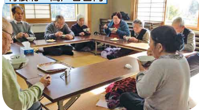
みんなですいとんを作って食べよう! おいしいさんま入りすいとんができました