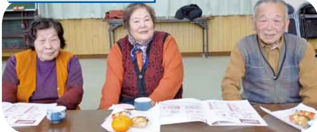
大腸がんについて 症状と予防を学び、健康管理を見直しました