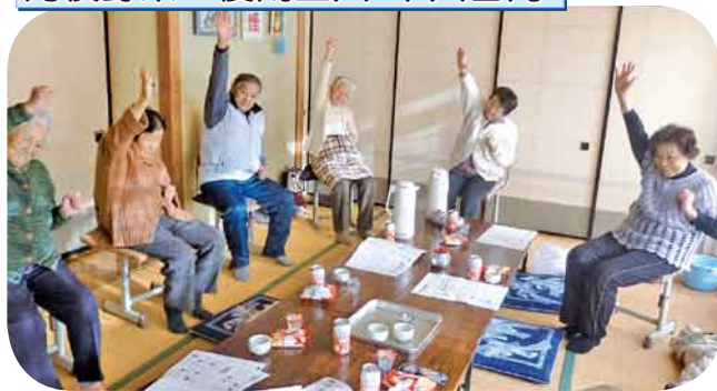
きよしのズンドコ体操/尿チェック 体操で体がぼかぼか温まりました