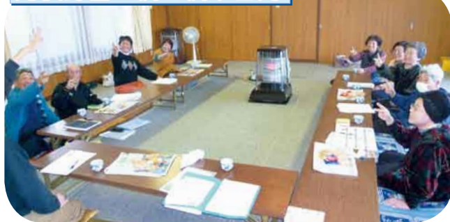
認知症の話/じゃんけん・リラックス体操 認知症予防に、ゲームや体操を楽しみました