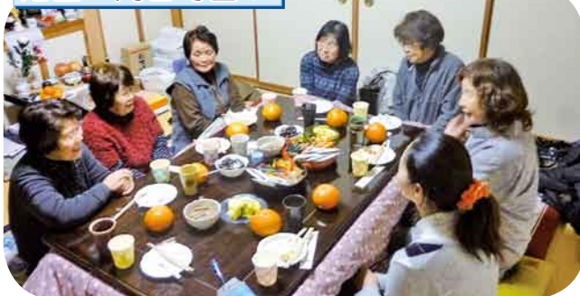
新年会 おいしい料理とおしゃべりで盛り上がりました