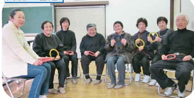
血管年齢チェック/輪投げ わきあいあいと輪投げを楽しみました