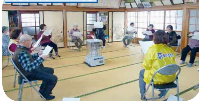
脳いきいき班会 頭や体を使って楽しく認知症予防に取り組みました