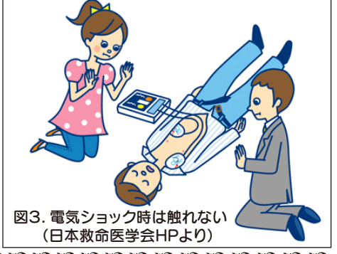
図3. 電気ショック時は触れない