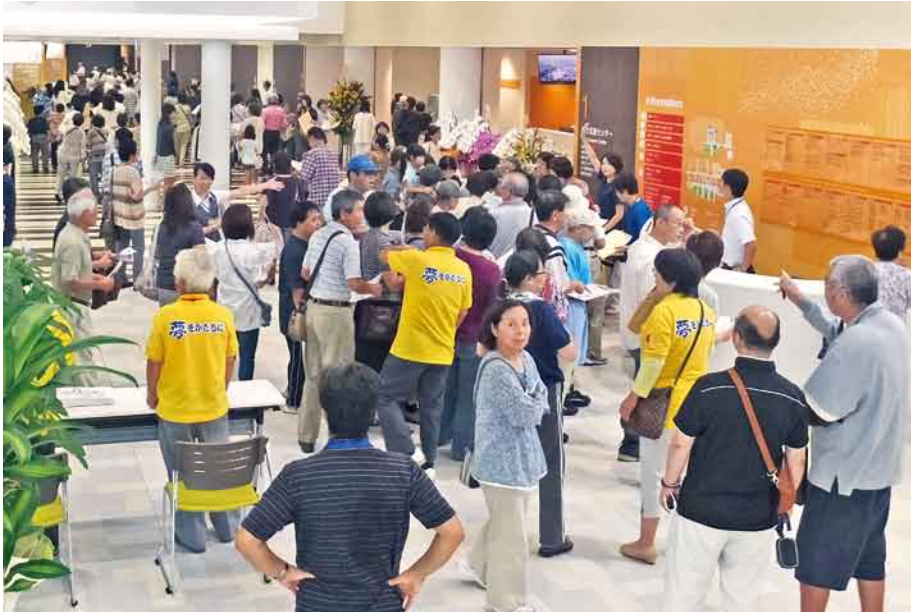
にぎわう受付・外来 (一般内覧会)

利根保健生活協同組合 〒378-0053 沼田市東原新町1861番地1 ☎0278(22)6060 FAX(22)6262 事業所 利根中央病院 ☎(22)4321 利根歯科診療所 ☎(24)9418 介護老人保健施設とね ☎(22)8855 とね訪問看護ステーション ☎(23)3706 とね診療所 ☎(24)1202 生協みなかみ歯科 ☎(25)3399 片品診療所 ☎(58)3910 ホームページアドレス http://www.tonehoken.or.jp/tonehoken-kumiai/