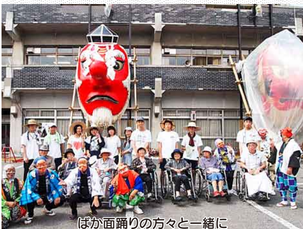
ほか面踊りの方々と一緒に

8月3日、4日の二日間、沼田祭り見物に出かけました。麦わら帽子にタオル、水分、うちわなど暑さ対策を万全にして、3日は10人、4日は7人の利用者さんが参加。「数年ぶりにお祭りに来てうれし」「お神輿が見られて良かった」などの声があり、お祭りの雰囲気を楽しみました。看護体験の学生さんも含め、のべ27人(学生22人、組合員5人)のボランティアさんの協力がありました。5日には毎年恒例の西原新町「ミニまんど」が直接老健とねに来てくれました。