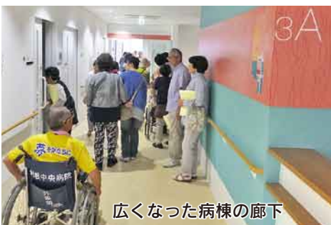
広がった病棟の廊下

病棟の 特徴的機能 各階で色分けされた病棟は、個室が現在の34床から84床になりました。 3階には、手術直後・重篤な患者さんを収容して高度な治療をするHCU(ハイケアユニット)12床、6階には、回復期リハビリ病棟33床を新設。脳卒中や大腿骨頸部骨折などの方は、転院しなくても一定期間のリハビリをできる家庭生活・社会復帰ができるようになります。 さらに、6階の産婦人科病棟にLDR室を設置。陣痛から出産、産後の体調回復時まで同じ部屋で過ごすことができます。