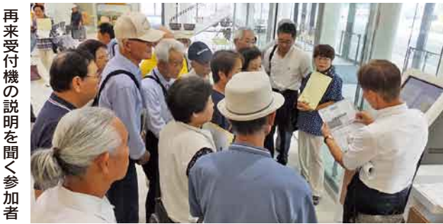
再来受付機の説明を聞く参加者