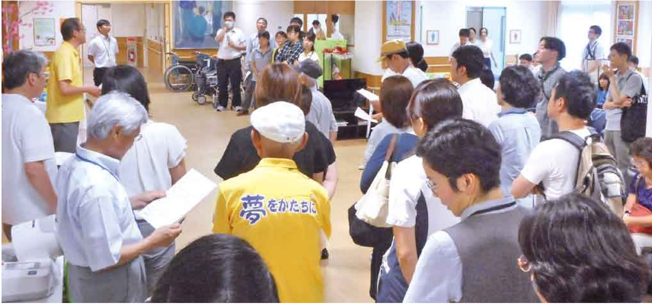
訪問前の意思統一の場

ホームページ 利根保健 で検索できます http://www.tonehoken.or.jp/tonehoken-kumiai/