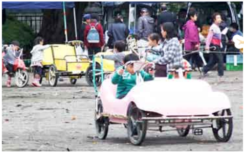
おもしろサイクルランド