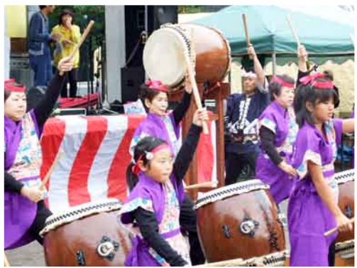
薄根ふるさと太鼓