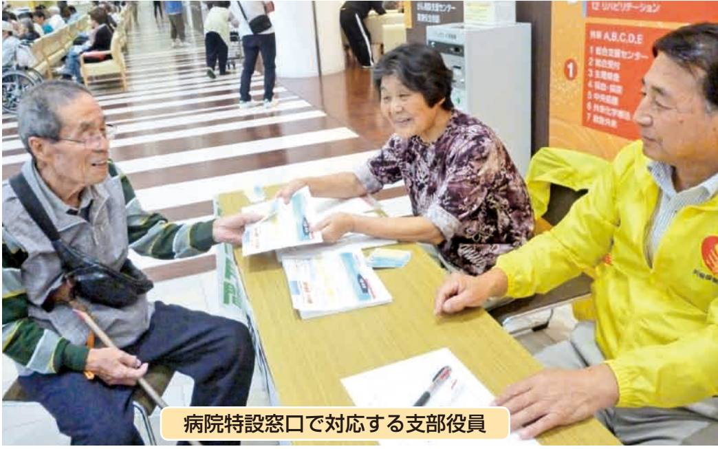
病院特設窓口で対応する支部役員

生協強化月間 が10月17日引き渡しとなりました。病院が移転し暗かった周辺が明るくなり、住民からも「また、安心できる」と喜ばれています。社会福祉法人「とね虹の会」が設立し、特別養護老人ホームが来年の秋完成を目指し動き始めています。ここに「生協強化月間」にあわせ事業所窓口でも「特設窓口」を設置しています。スタート集合翌日から10月末まで、「年に1回は増資を」と支部役員と職員で連日呼びかけがされた病院。その他の事業所では、利用委員が期間を決めて呼びかけています。今年、「利根中央診療所竣工記念増資」(一口5千円以上)も皆さんにお願いしています。