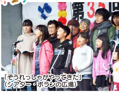
「そうれっしやがやってきた」(シアター・ポラシの広場)