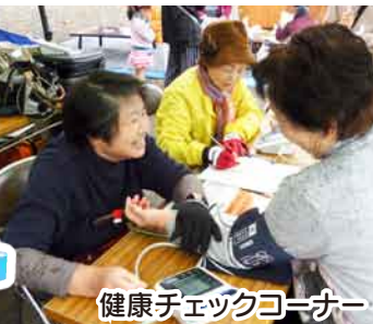
健康チェックコーナー

10月15日(日)、沼田十王公園にて、毎年恒例のくらしと健康まつりが開催され、今年も雨の中、1800人が来場しました。昨年引き続き薄根ふるさと太鼓のオープニングと、穂苅清一実行委員長代理、横山公一市長、星野稔市長、ハートのステッキ