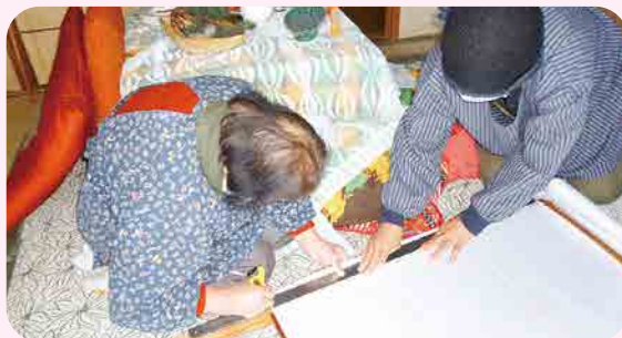
利南支部 /障子貼り