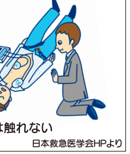
電気シヨック時は触れない 日本救急医学会HPより

日本では 各種さ まざま なAED が販売 されて いま す。自 分の住 んでいる 地域 や施設 に、ど んなA EDが あるの か調べ てみま しょう。