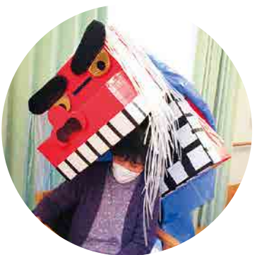
獅子に頭をガブリ!

職員による獅子舞披露では、段ボールで手作りした獅子を被り、利用者一人ひとりの頭を噛んでまわり場を和ませました。 利用者様からは「頭を噛んでもらったからボケなくなる」「いい正月になった」などの声が聞かれました。