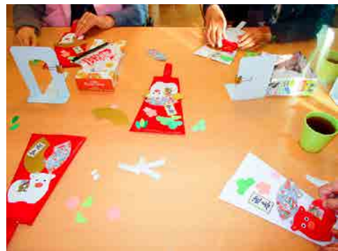
思いおもいに羽子板づくり