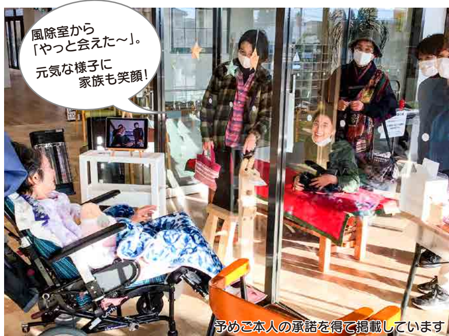
予めご本人の承諾を得て掲載しています

長く施設で過ごされている入居者様にとっては、ご家族とのつながりが生きていく上での心のよりどころになっています。