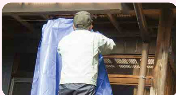
沼田北支部 /シート交換