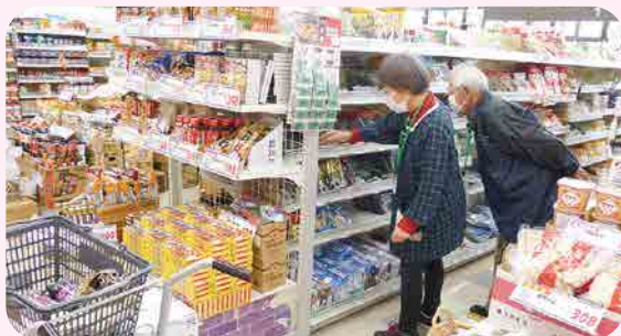
利南支部 /買い物代行