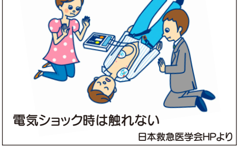
電気シヨック時は触れない 日本救急医学会HPより