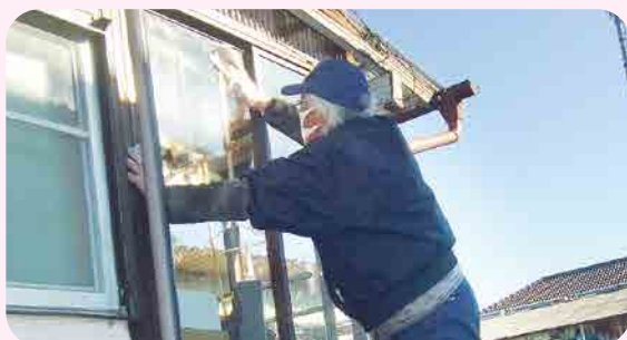
沼田北支部 /窓ふき