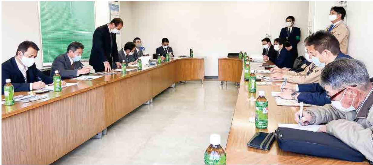
各団体の役職員18人が参加