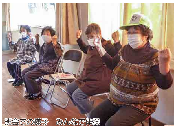
班会での様子 みんなで体操

世界では、はしかや結核など予防が可能な病気で命を落とす子どもが、毎日1万5千人もいたり、妊娠や出産による合併症で亡くなる女性の数も一日に数百万人と言われています。この状況は、予防接種、教育による予防知識や治療など性差に関係なく受けられることで回避できます。