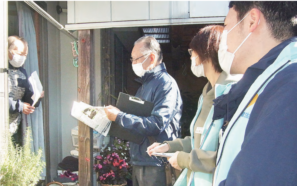
組合員さんの声を聴く地域訪問 (沼田北支部)

利根保健生活協同組合 〒378-0053 沼田市東原新町1861番地1 ☎0278(22)6060 FAX(22)6262 利根中央病院 沼田市沼須町 ☎(22)4321 片品診療所 片品村鎌田 ☎(58)3910 利根中央診療所 沼田市西原新町 ☎(24)1202 利根歯科診療所 沼田市高橋場町 ☎(24)9418 生協みなかみ歯科 みなかみ町後閑 ☎(25)3399 介護老人保健施設とね 沼田市東原新町 ☎(22)8855 サニーホームひまわり 沼田市高橋場町 ☎(22)3223