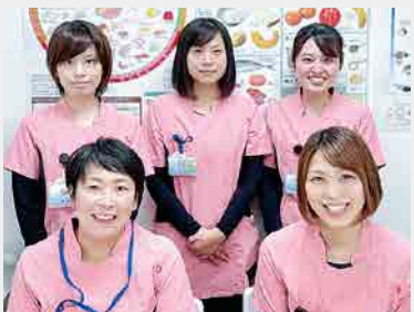
撮影のためマスクを外しています。

糖尿病治療にもっとも大切な自己管理(療養)を患者さんに指導する医療スタッフです。糖尿病治療の柱である食事療法についての指導のほか、療養生活のアドバイスなども行っています。