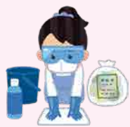
図1・図2：嘔吐物の処理方法 (群馬県ホームページより一部抜粋)