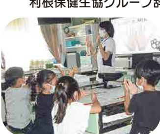
小学校での手洗い教室(6月)