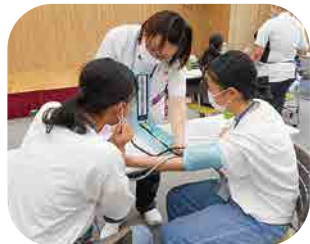
高校生看護体験 血圧測定の体験(7・8月)