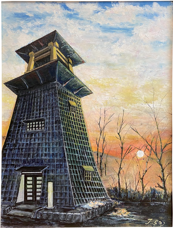
油彩画「残雪」 沼田市上原町 伊藤 知幸