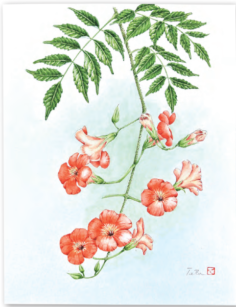
水彩画「ノウゼンカズラ」 沼田市材木町 細山 照次