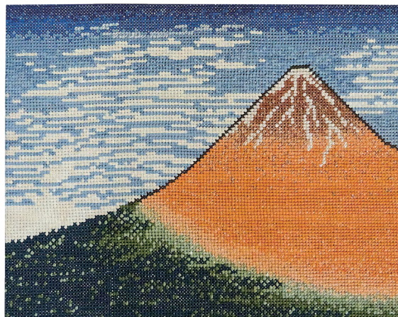
クロスステッチ「富嶽三十六景」 みなかみ町月夜野 長濱 貴美子