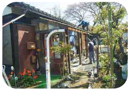
助け合い活動 作業の様子(4月)