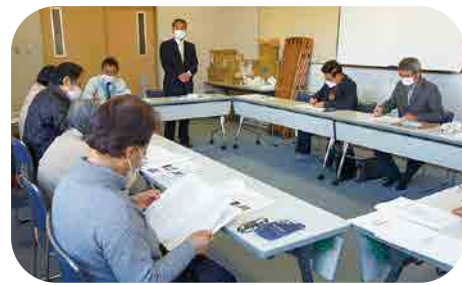
昭和東・南支部合同が昭利村社会福祉協議会と懇談(1月)