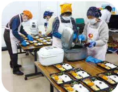
みんなの食堂 弁当配布の準備(11月)