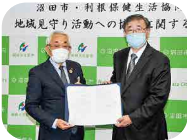
地域見守り活動 沼田市と協定締結(9月)