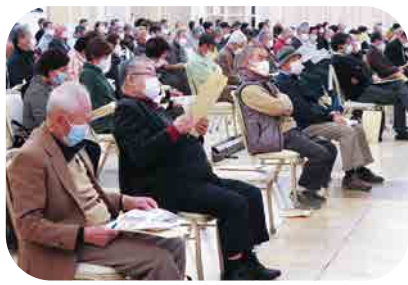
組合員活動交流集会(3月)