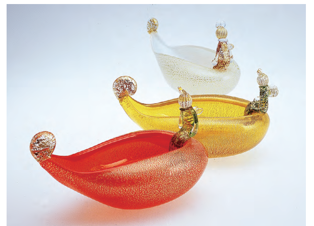
ガラス工芸「花びらの舟に乗って」 沼田市町田町 室 伸一