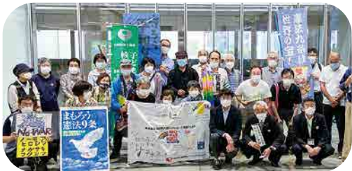
国民平和大行進 テラス沼田(7月)