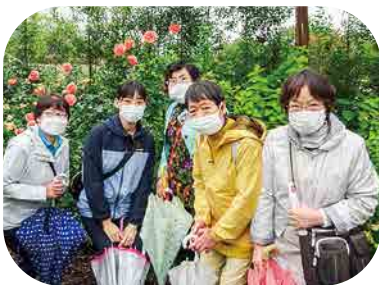
県女性協 中之条ガーデンズ視察研修(10月)