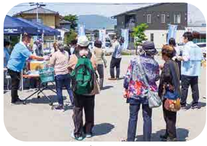
フードドライブ「おすそわけ」(5月)