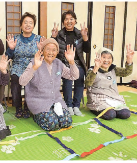
※写真撮影のためマスクをはずしています

昨年(2021年)の総代会では「あつて良かった利根保健生協」で象徴される「全世代のくらしの安心づくりに貢献」する3カ年計画のまとめの年であるとしてきました。また、昨年9月に沼田市と「地域見守り活動に関する協定書」を締結しました。今年も、人づくり、健康づくり、まちづくりの組合員活動を利根沼田地域で具体的に推し進めて行くにはありませぬか。いま、日本全体が文化的にも経済的にも二流国に落ちつつあります。私たちの生協の力を発揮することで、地域の生活を支え、日本の発展に寄与することができると思っています。今年(2022年)は寅年です。最強の干支にあやかっただけで済ませず、大きな目標を立てて進みましょう。今年一年が皆様にとって幸多い年になりますよう心よりお祈り申し上げます。