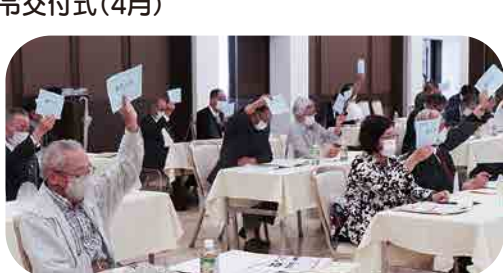
通常総代会 規模を縮小して開催(6月)