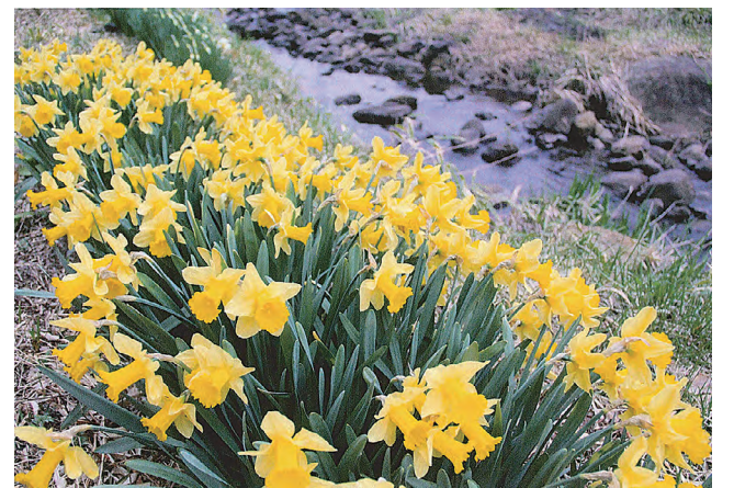
写真「もうすぐ春」 高山村中山 中嶋 輝久