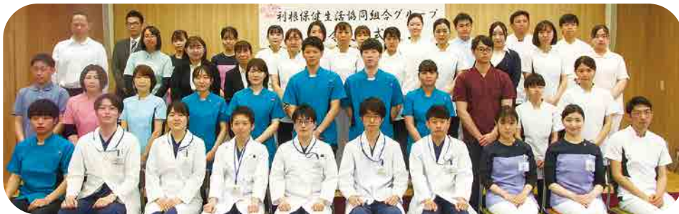
利根保健生協グループ辞令交付式(4月)