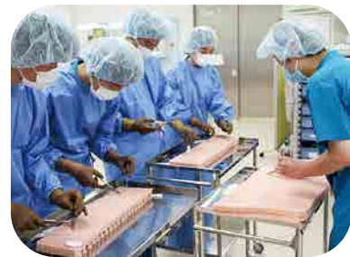
高校生医師・多職種体験 縫合体験(8月)