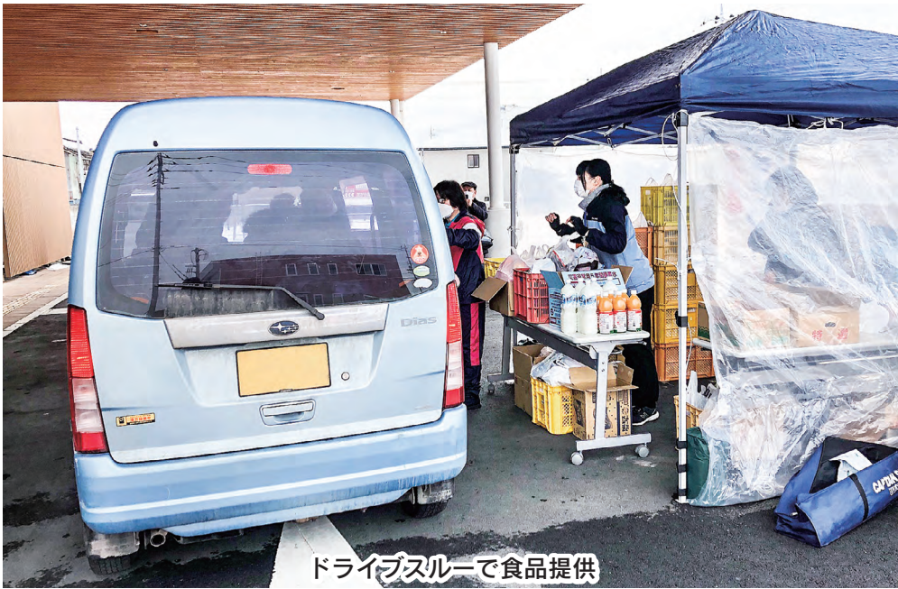
ドライブスルーで食品提供