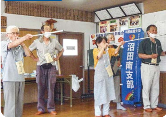
健康吹き矢で楽しく交流。