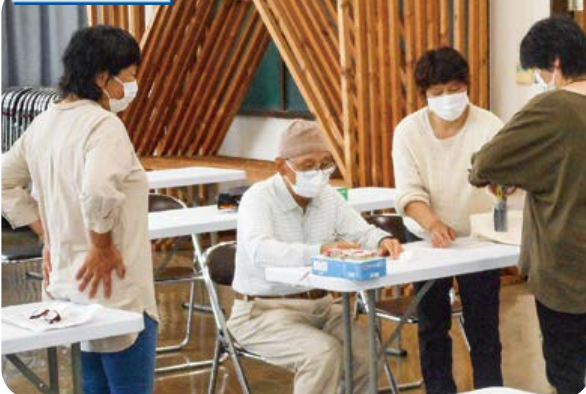
握力測定で力だめし。