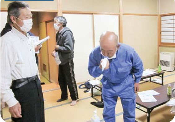
タスクルで呼気圧を測定。最高値も。