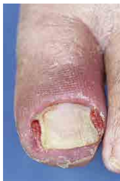
図1 深爪の喰い込みみによる肉芽ができてしまった陥入爪

「陥入爪」は爪自体の変形は少ないものの爪の側縁だけ少し曲がっていたり、深爪してしまっその先端が皮膚に喰い込んでし