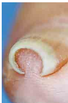
図2 爪が彎曲してしまった高度の巻き爪

のができてしまうこともありま す(図1)。 これを「肉芽(にくげ)」とい いますが、肉芽ができる、さ らに爪を圧迫するので痛みが強 くなってしまう。