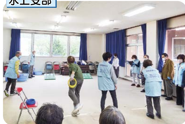
輪投げ大会で大盛り上がり。健康チェックも。