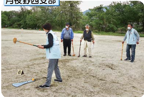
グラウンド・ゴルフで初心者も楽しく交流。