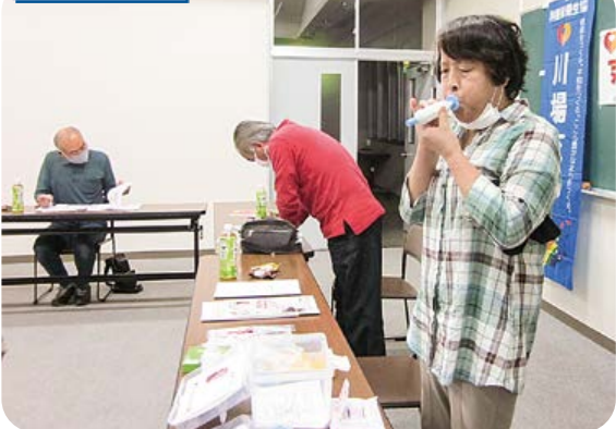
タスクルで呼気圧を測定。吹きもどしも購入。