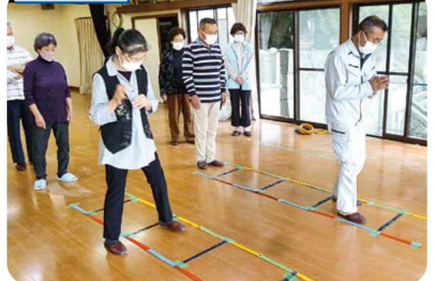
4色あしびみラダーで交流。輪投げも楽しむ。