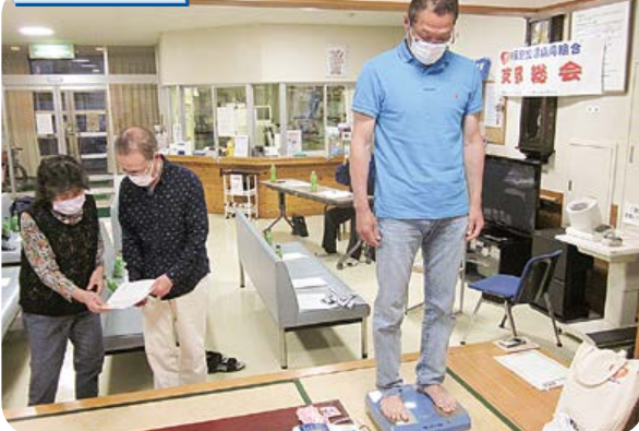
今日の体脂肪・体内年齢はどうか。