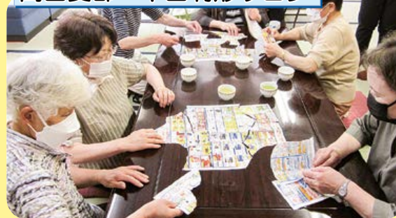
村の保健師さんも参加して熱中症について学習。「きよしのズンドコ体操」でからだを動かし、切った広告のパズル合わせで脳トレ。