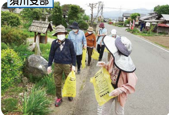
たくみの里にてゴミ拾いウォーキング。気持ちのいい汗を流す。