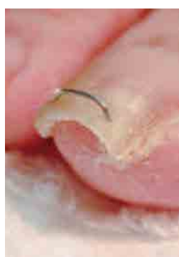
図4 ワイヤー挿入により爪を開く方法

形状記憶のワイヤーを爪に装着し、彎曲した爪を持ち上げることで痛みをとります。彎曲の強い巻き爪で、爪がある程度のびている方には行なえます(図4)。