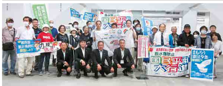
出発式に集まった各団体参加者(テラス沼田にて) 撮影時のみマスクをはずしています

【私たち(こころの里)】 ・ゴミを増やさない。川や海に捨てない ・清掃ボランティアへの参加