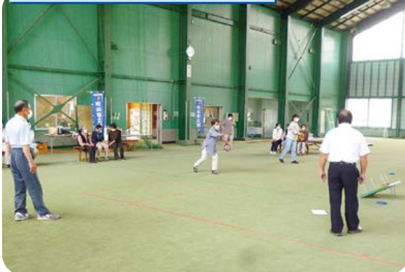
輪投げ大会で職員も一緒に交流。