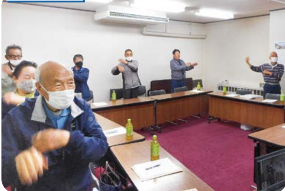
きよしのズンドコ体操で体をほぐす。