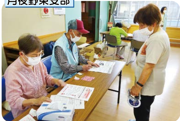
組合員さん同士でピンゴゲームと健康チェック。