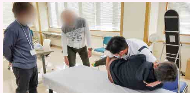
体位交換を学ぶ様子

今年も短冊を入院患者様と職員に配り、願い事を書いてもらい、笹に飾って七夕飾りをつくりました。「まっすぐ天に向かって伸びる笹に短冊を飾ることで、天界にいる神様やご先祖様に願い事が届きやすい」と言われています。いまだコロナとの戦いは終息が見えず気持ちは沈みがちになりますが、伝統的な行事に触れることで穏やかな気持ちになっただけなのではないでしょうか。