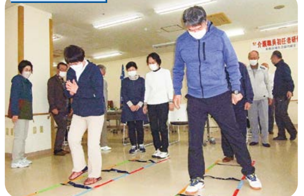
4色あしびみラダーで脳の活性化。