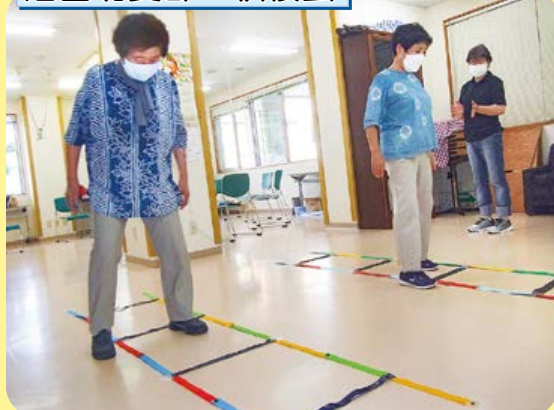
いつもは毎週金曜日に太極拳などをしていましたが、今回は「4色あしびみらダー」に挑戦。