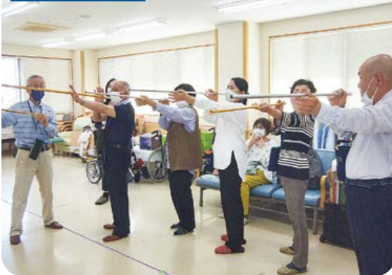
健康吹き矢で交流。姿勢から学ぶ。