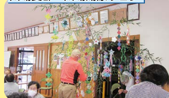
5ヶ月ぶりに集まり七夕飾りを制作。参加者は短冊を笹に吊るし、みんなで「たなばたさま」を歌い鑑賞。