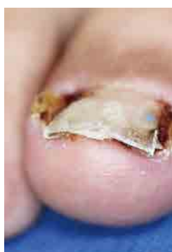
図6 陥入爪に対する装着装具で爪を持ち上げることで痛みを軽くする

爪自体の曲がりが少ない陥入爪でも、爪を持ち上げるように装着することで痛みを軽くすることが出来ます(図6)。