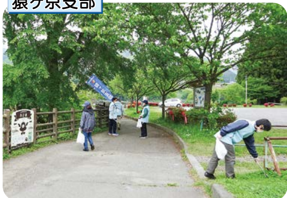
赤谷湖畔遊歩道の約5kmをゴミ拾いウォーキング。