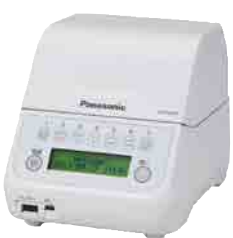
口腔内細菌カウンタ

この最近では約1分でお 口の中の菌数を調べるこ とが出来ました。是非、歯 科医院で今のご自身の状 態を知り、自分にあつたお 手入れや口周りの使い方 が実践できるようになっ て頂けたらうれしいです。 お口の中を綺麗に保ち、 美味しく食べたり、たくさ ん笑えるような素敵な生 活を目指しましょう!!