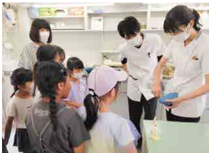
歯の模型を作る石膏を練る作業