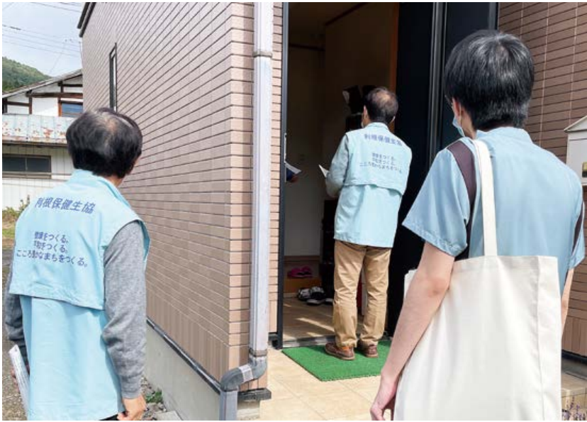
昨年度の地域訪問