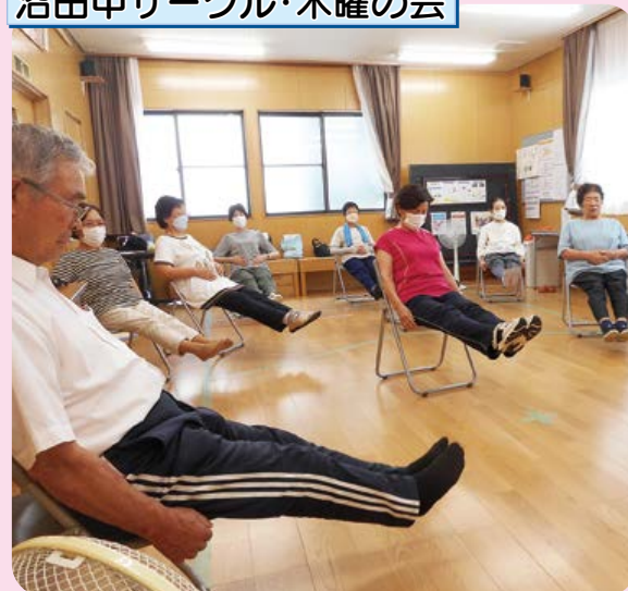
沼田中サークル・木曜の会

いつもは卓球ですが、夏場は暑いので変更して今日は保健師さんの指導のもと福老体操です。いつも増して力がはいりました。足上げで腹筋が鍛えられます。この後、ポッチャを楽しみました。