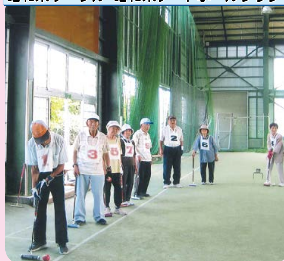
昭東東サークル・昭東東ゲートボールクラブ

酷暑が続き、涼しい部屋にこもりがちですが、みんなで週に3回集まって元気に体を動かしています。10~15人の参加者で和気あいあいと楽しみながら続けているサークルです。