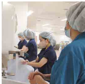
手術前の手洗いを体験

看護師から看護学校への受験対策や学校生活について聞く場面では真剣に耳を傾けていました。お揃いのユニフォームに身を包み気恥ずかしそうにしている姿が印象に残りました。今回の体験をきっかけに、将来はぜひ看護学校へ入学し夢を叶えて欲しいと思います。