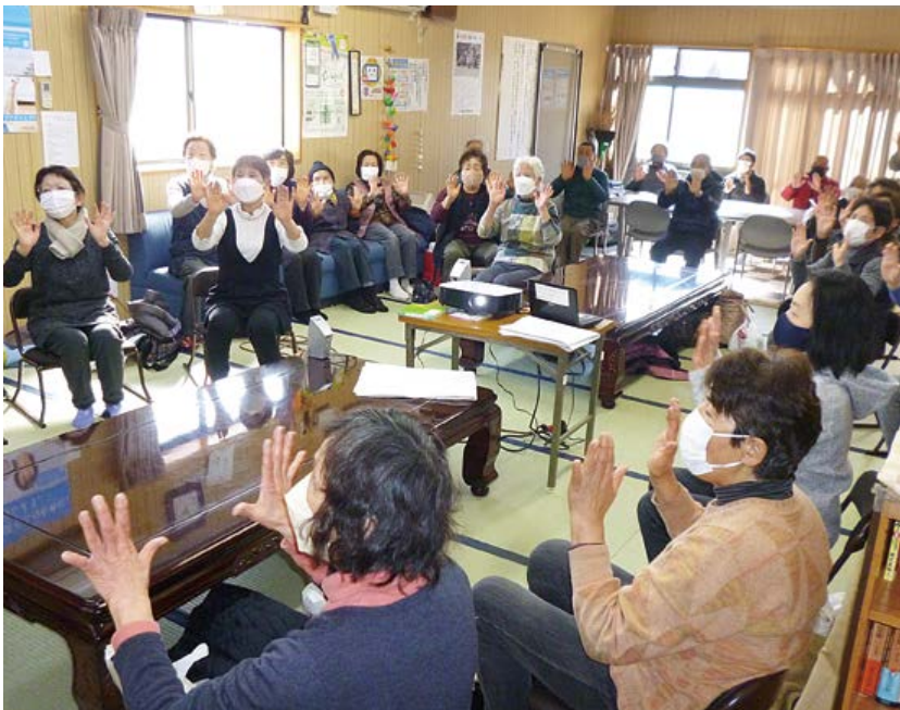
楽しく脳トレでフレイル予防 (高山支部 判形サロン)