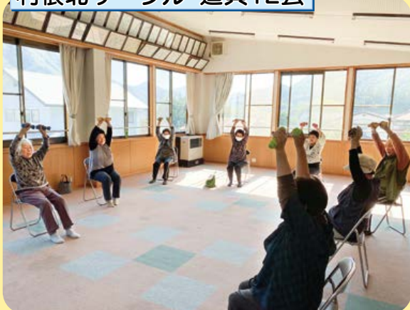
利根北サークル・追貝12会

「健康づくりが大事！」と感染予防をしながら毎週火曜日に行っています。主に福老体操を中心に、みんなで元気に楽しみながら参加しています。今年でサークル活動も5年目となりました。