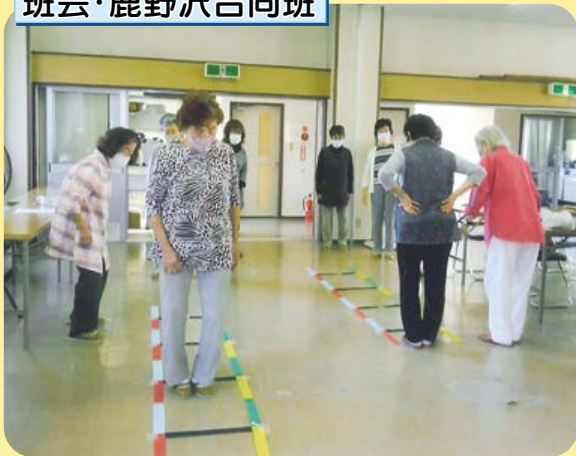
班会・鹿野沢合同班

約3年ぶりに開催。集まった13人でお口、頭の体操、4色あしびみラダーを行いました。最初は難しく感じましたがだんだんとみんな出来るようになりました。短い時間でしたが笑いもあり、楽しく過ごすことが出来ました。