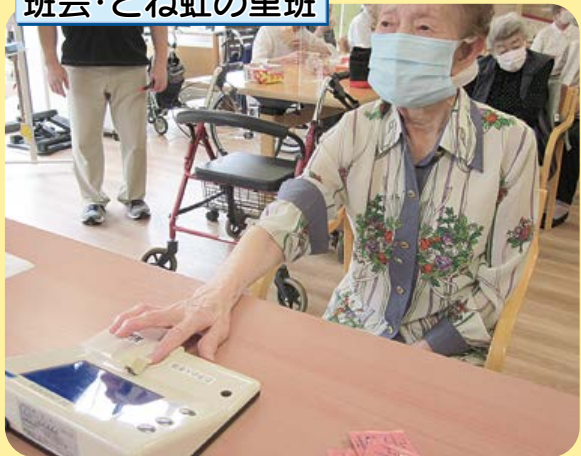
班会・とね虹の里班

虹の里デイサービスを利用している皆さんとDVDに合わせて体操を行った後に、血管年齢測定を実施。参加して下さった方々の実年齢は70歳～93歳で、測定結果はほとんどの方が実年齢よりも若い結果となり、喜ばれる姿が印象的でした。また半年後に測定を行う予定です。