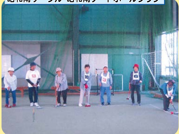
昭和南サークル・昭和南ゲートボールクラブ

暑さも和らぎ、活動しやすい時期となりました。週3回、11人ほどが集まり、昭和東サークルと合同でゲートボールを楽しんでいます。人数も多くなり、とても盛り上がりです。