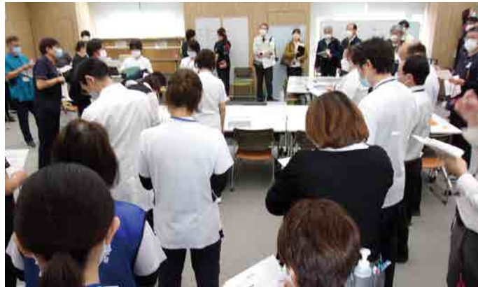
情報収集と対応策を検討する災害対策本部

11月2日(木)利根中央病院において、沼田高校の芸術ゼミ、吹奏楽部、軽音楽部の生徒さん約30人による慰問演奏会が行われました。 5月に沼田高校の先生から利根中央病院で慰問演奏したいとお話しをいただき、初めての慰問演奏をお受けしました。 沼田高校では芸術ゼミの活動目標に地域で演奏活動を行うことを決めて、早朝や昼休み、放課後に練習を重ねて、当日を迎えました。 会場には各病棟の職員が入院患者さんをお連れして、