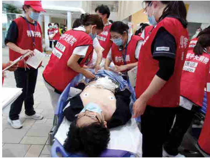
重症患者に対応するレッドゾーン

利根中央病院では、災害時の対応に特化した訓練を行っており、今回の訓練でも教育を受けた職員が 利根中央病院では、災害時の対応に特化した訓練を行っており、今回の訓練でも教育を受けた職員が 今年度は2024年2月にも病院避難を想定した水害対応災害訓練も行う予定となっております。利根中央病院は災害拠点病院としての役割を果たすため、いざという時に備え、病院職員一丸となり、地域の皆様のお力になれるよう日々努力していきます。