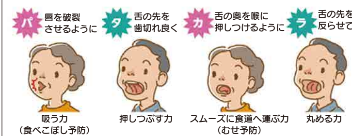
図2 パタカラ体操

「パ」「タ」「カ」「ラ」の4文字を発音することによって、舌の筋肉を使い、食べる・飲み込む機能を鍛える体操です。口の準備運動として、舌の準備運動として食べる前に各10回程度行います。