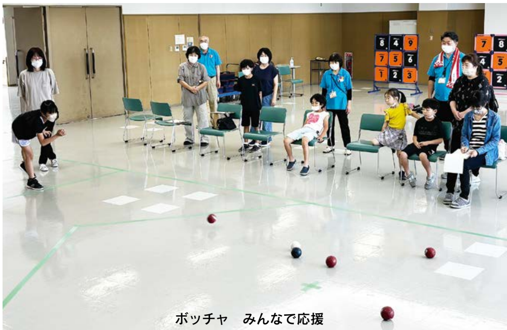
ボッチャ みんなで応援

利根中央病院 沼田市沼須町 ☎(22)4321 片品診療所 片品村鎌田 ☎(58)3910 利根中央診療所 沼田市西原新町 ☎(24)1202 利根歯科診療所 沼田市高橋場町 ☎(24)9418 生協みなかみ歯科 みなかみ町後閑 ☎(25)3399 介護老人保健施設とね 沼田市東原新町 ☎(22)8855 サニーホームひまわり 沼田市高橋場町 ☎(22)3223