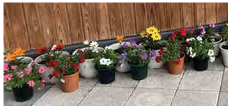
生協みななかみ歯科玄関前でも飾られています