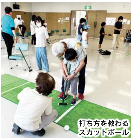
打ち方を教わるスカットボール

「やったね!」「がんばったね!」など楽しむ声が聞かれます!と意気込みが聞かれ、決勝戦では、他の参加者からも「あー惜しい」「すごい」などの声援で大変盛り上がりました。