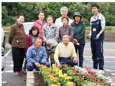
病院職員と共に花壇整備をしました