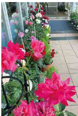
利根歯科診療所玄関前の鮮やかな薔薇でお出迎え

受付時間 (祝日を除く) 月～金曜 9:00～16:30 土曜 9:00～12:00