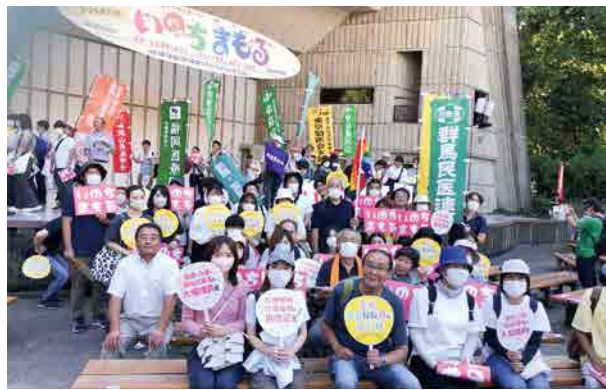
手前の3列は利根保健生協からの参加者

「みんなで心を合わせ、声を上げる」まで、何かが変われば」 9月26日(木)、東京・日比谷野外音楽堂にて、医療・介護・福祉の充実を求める「いのちまもる総行動」が開かれ、全国から2400人が現地参加。群馬は71人のうち利根からは20人が参加しました。 集会では、国会議員からの連帯挨拶、能登半島地震被災地からの訴え、医療・介護・福祉・保育の各分野報告、集会アピールを通じて、社会保障拡充にむけた団結を深めました。参加者からは「ケア労働者の大幅賃上げと増員をというアピールに全国からこれだけ多くの思いがあつたり、行動する意味と重さを痛感した」「社会を変える意味について考えた」などの感想が聞かれました。