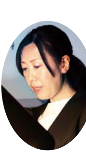
地域訪問では総代さんが「いつ、誰が、どこに行くか」決めて、毎年決まったお宅へ地域訪問をすることで今では職員のこと覚えてくださいます。「頑張ればできる」を信じて支部を盛り上げていきたいです。

新巻支部から分割して10年が経過しました。機関紙配布はほぼ全地域でできています。支部の役員や地域の班長さんにもお世話になっていきます。